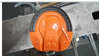
RAZER FLAP PAD