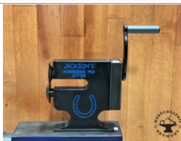
JACKSON PAD CUTTER