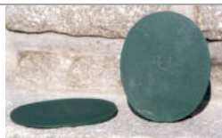
2 DEGRÉ OVAL