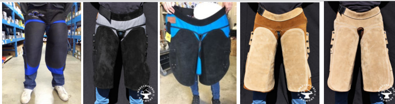
BATTLECREEK GIBBINS FLAMEMASTER GIBBINS RIPSTOP GIBBINS SUPERLITE GIBBINS SUPERTHISTLE