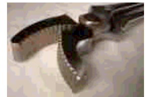
GE Curved Jaw