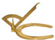
BRASS Hoof Gauge