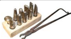
BLU Fullering Tool Set