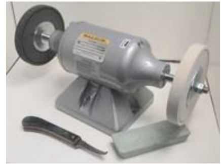
Baldor w/sharpening wheels