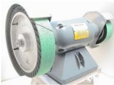
Baldor w/expander wheels