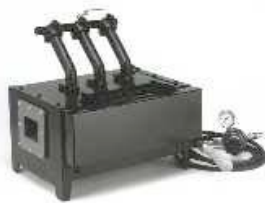
Whisper Low Boy